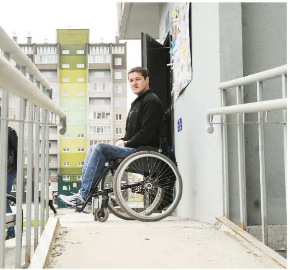
Об удобстве для инвалидов часто думают в последнюю очередь.

На момент покупки пандус (с противоположной сто-