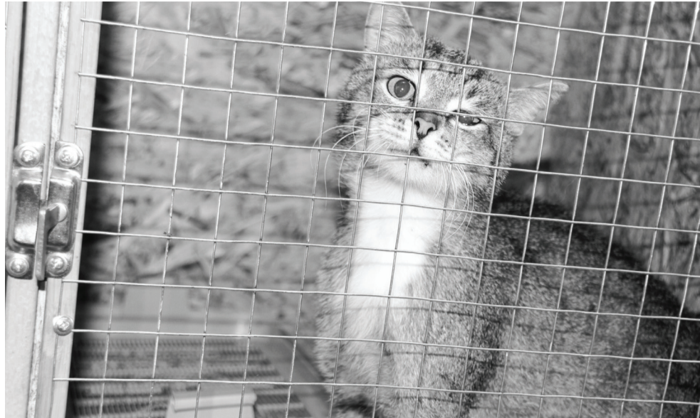
Вопрос безнадзорных животных – и совершенно неважно, собака это или кошка – крайне животрепещущий, он находит отклик в каждом. Те, кто хочет подарить заботу и ласку ушастикам, могут посетить приют: ул. Заречная, 1, строение 10/1, тел. 7-82-89.