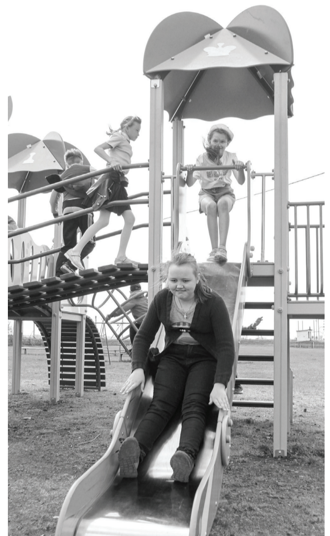
18 площадок для культурного и спортивного досуга на открытом воздухе будут работать до конца лета во всех районах города.

До начала учебного года остается неделя, но летние спортивные и досуговые площадки продолжают работать до конца августа.