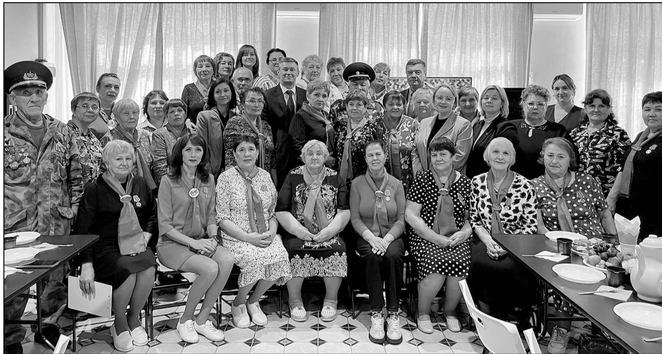
«Горьковские берегини» недавно принимали у себя депутатов областной и районной Дум.