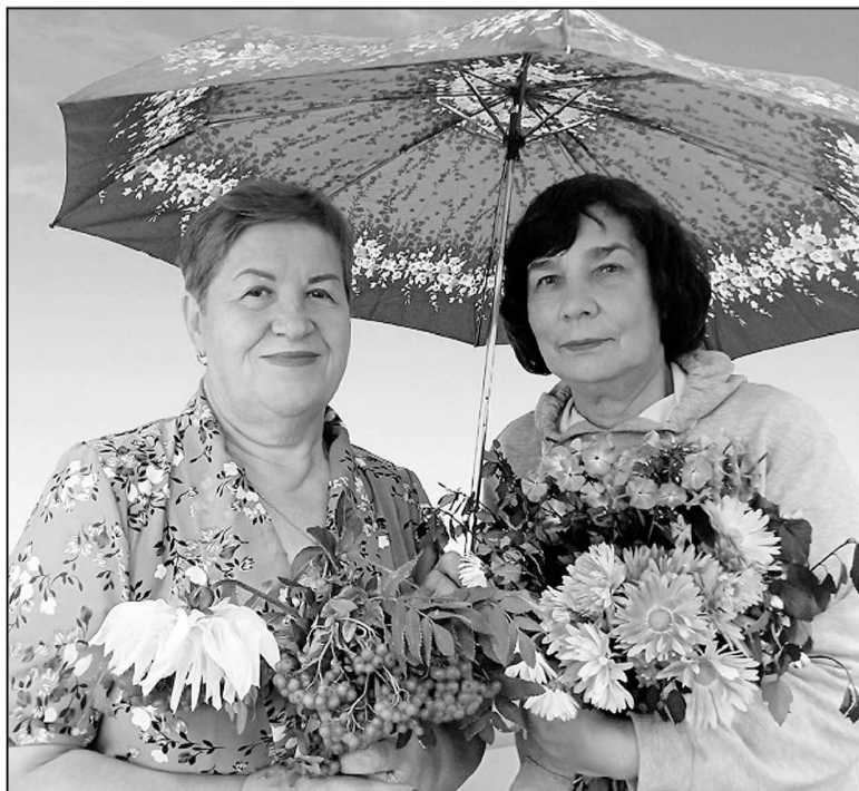
Фотосессия в осеннем образе.