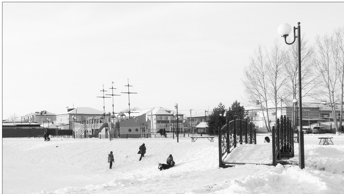
Национальный проект «Городская среда» - парк по ул. Пушкина с. Абатское

– Прежде всего, хочу выразить слова благодарности своей команде заместителей, начальников отделов и всем сотрудникам администрации, кто делает незаметную, но очень важную работу, а также руководителей организаций, депутатам районной думы, совету ветеранов, общественной молодёжной палате, предпринимателям, которые сотрудничали с нами на протяжении всего года. Надеюсь на плодотворную совместную работу в 2020 году во благо родного района и его жителей. Сердечно поздравляю всех земляков с Новым годом и Рождеством Христовым!