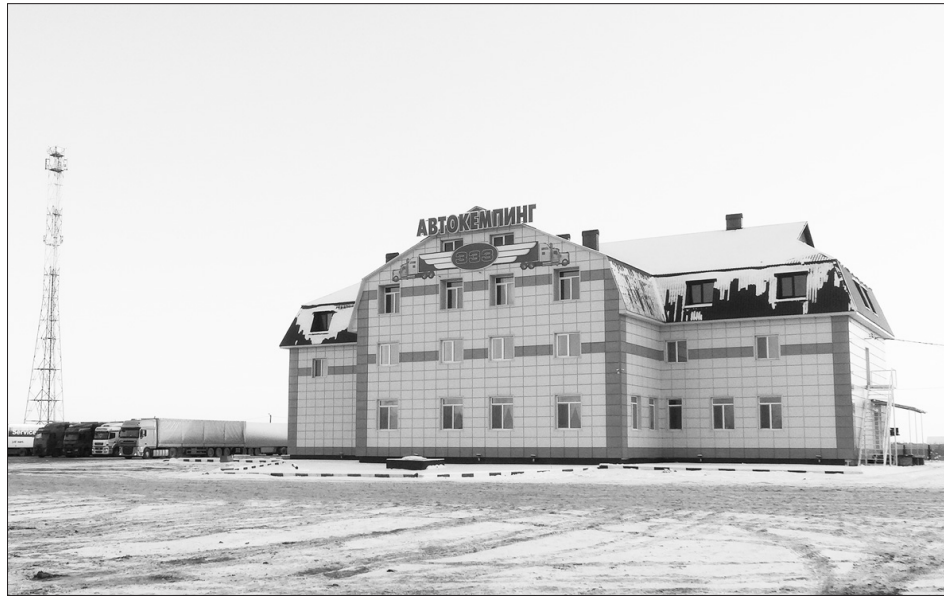
Автокемпинг «333» в с. Тушнолобово

- Хочу отметить, впервые мы можем констатировать факт, что бюджет Абатского района в текущем году составил 1 миллиард рублей. Мы также перевыполняем плановые назначения собственных доходов, и