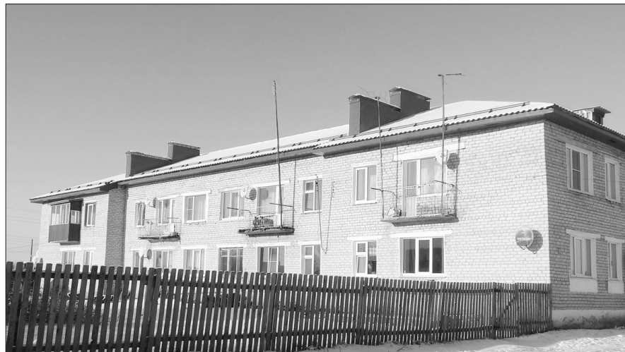
Новая кровля МКД в с. Шевырино

Продолжение. Начало на 2 стр. ным ограждением в с. Абатское по ул. Лермонтова, ул. Ленина, в с. Ст.-Маслянка, Шевирино. В рамках дорожных работ выполнено новое уличное освещение в с. Абатское на улицах Лермонтова, 1 Мая, Дорожная, 50 лет Октября, Мелиораторов, Кирова, а также на централь-