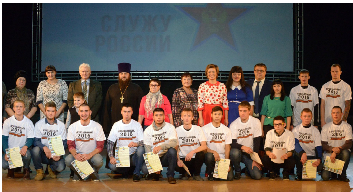
Счастливой службы, призывники!