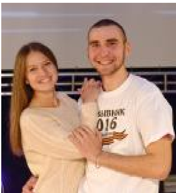
«Ты служи, я подожду!» (Ю.Мекаева, В.Поросных)

ва, танцевальная группа «Казачья вольница». Приемы рукопашного боя продемонстрировали воспитанники военизированного кружка «Юные ратники» (ОСОШ №1), курсанты СГ ДПВС «Лидер» и «Сокол» (руководитель В.В.Гебель).