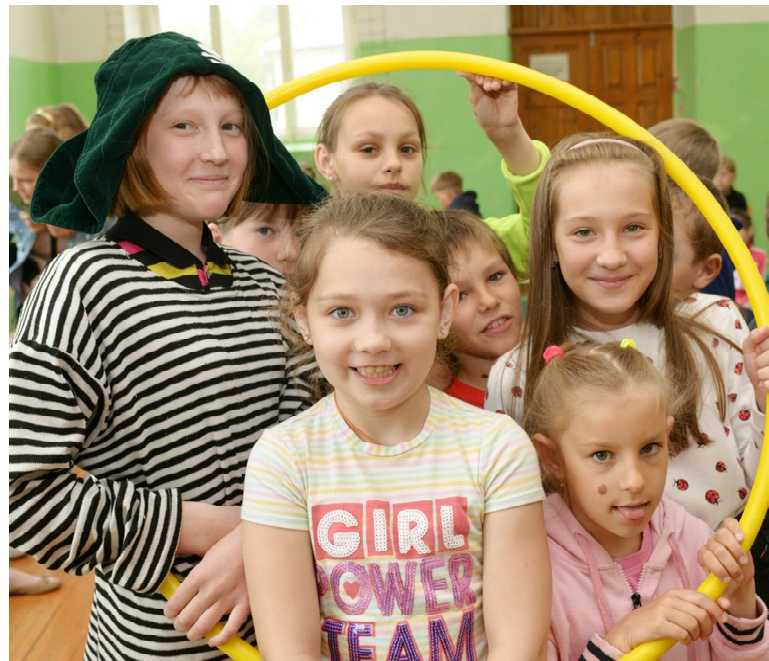
Для каждого в команде найдется место, даже в обруче