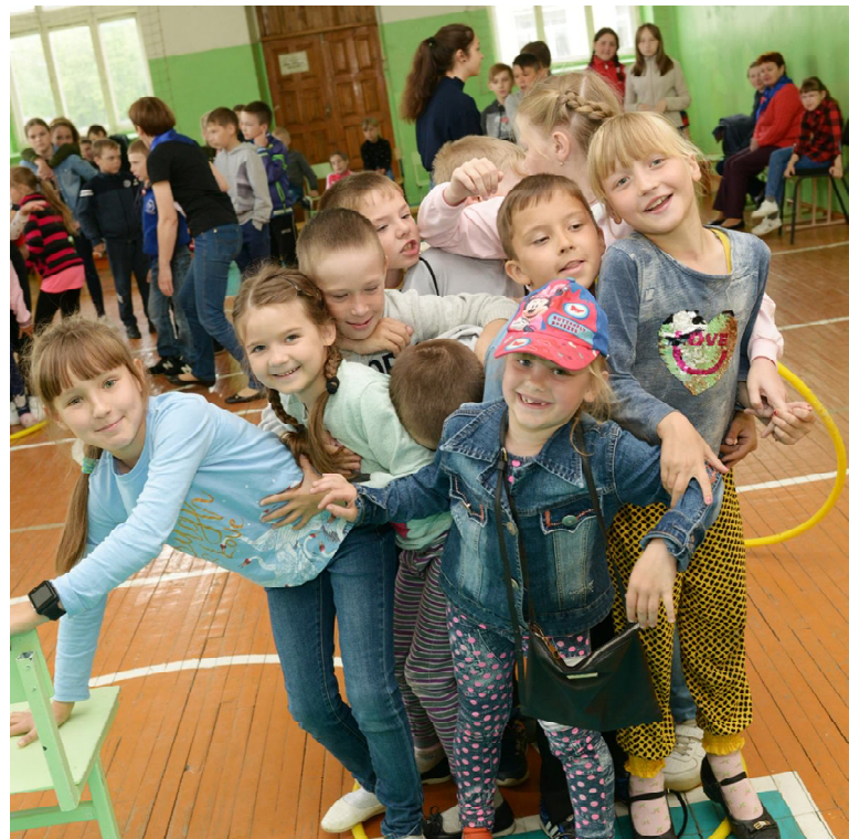
В лагере нет места скуке!