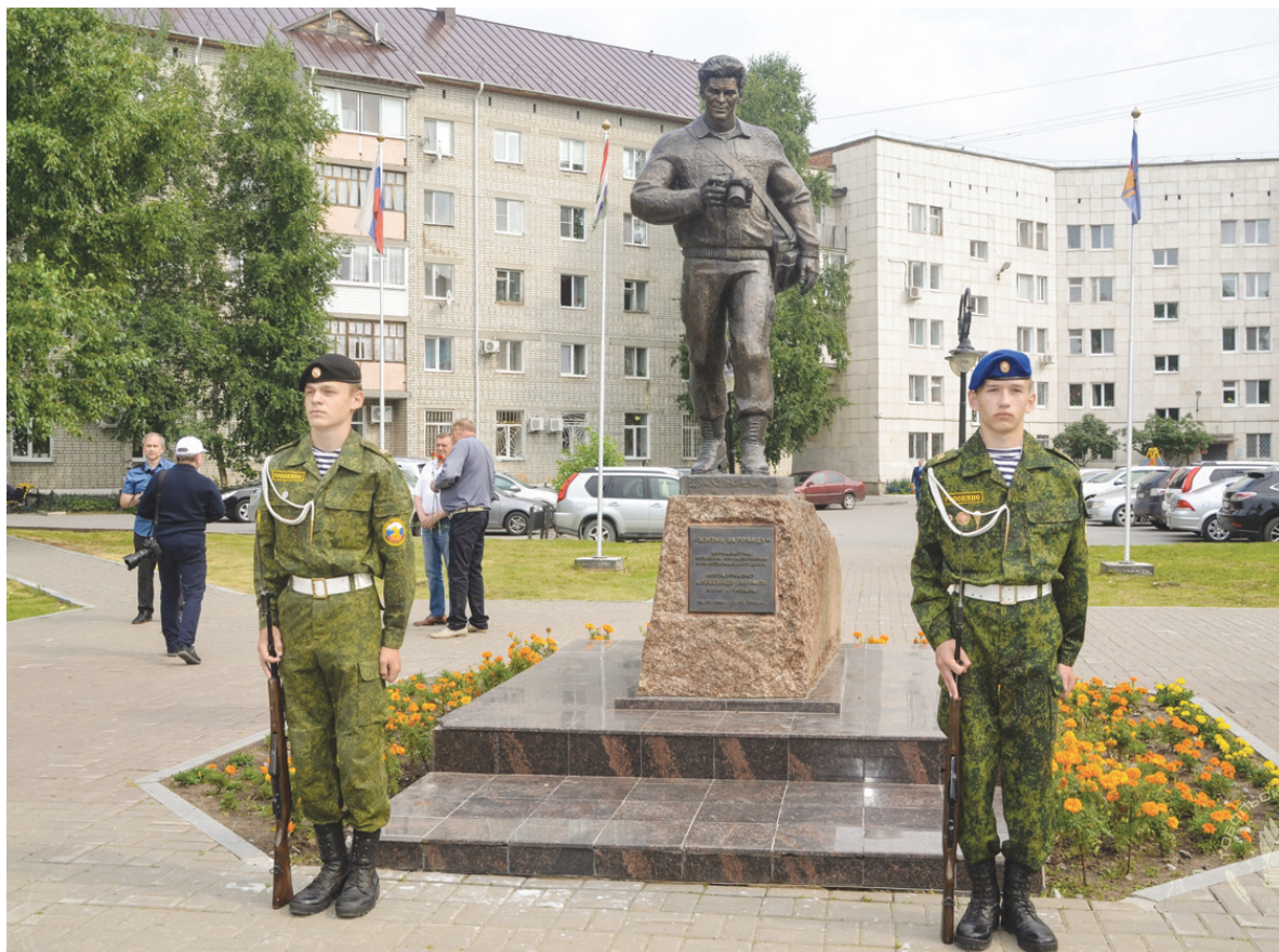
Почётный караул «Россиян»

А по окончании занятий все участники фотофорума собрались в сквере «Тобольской правды» у памятника «Жизнь за правду», установленного