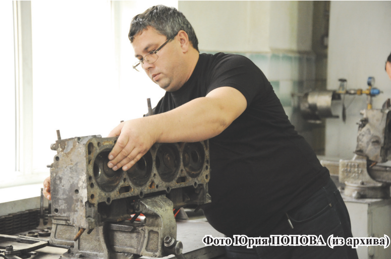
В ПАТП поставили цель — сократить время на проведение ТО-2 до 7,5 ча- сов без потери качества технического обслуживания

Такие рабочие встречи в июле ста- ли доброй традицией, а в этом году,