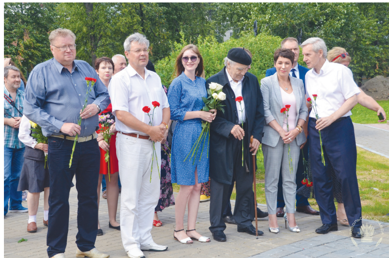
Сюда не зарастёт народная тропа

4 августа Температура воздуха +15...+16°C, атмосферное давление – 744 мм рт. ст., ветер ю, ю-з, 4-6 м/с, пасмурно, небольшой дождь.