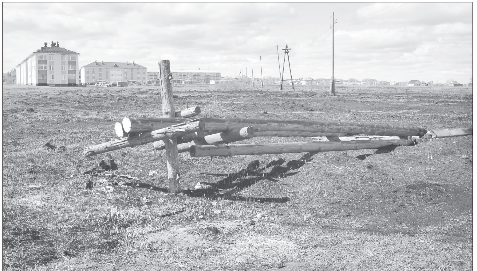
В майские праздники в 2017 году нерадивые ялуторовчане готовили шашлык во время сухой ветреной погоды, что привело к ландшафтному пожару на площади в два гектара в районе улицы Полевой

Стоит отметить, что многое зависит от погодных условий. Если ожидается жара и сильный ветер, то разведение огня могут запретить даже на массовом мероприятии.