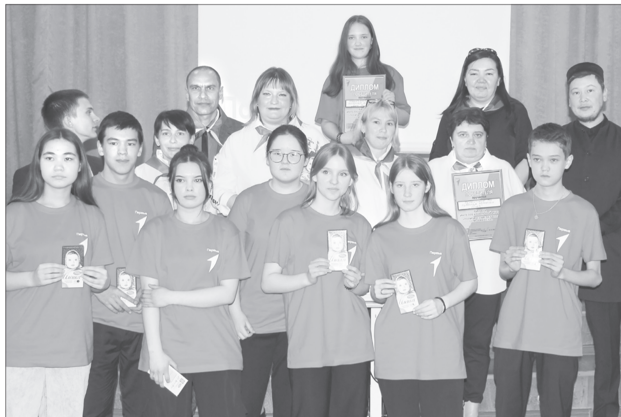
Победителями признали сразу две команды: «Союз» из Беркутского школьного округа и «Дети родичей» из Новоатъялово. Все участники получили дипломы и сладкие подарки

Третью интеллектуальную игру «Политические дебаты» впервые провели среди детей и взрослых