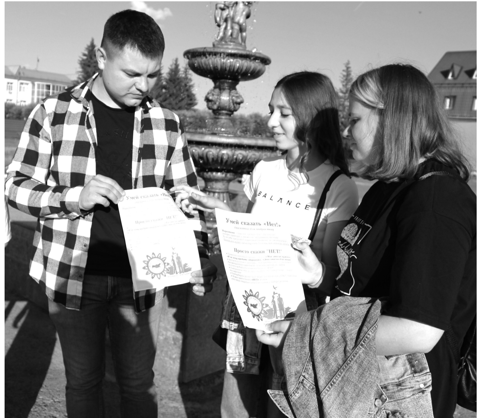
Организаторы акции вручали подросткам брошюры "Вместе – против наркотиков"

В области создана циклическая система оказания помощи наркологическим больным, которая включает три этапа: амбулаторный, стационарный и реабилитацион-