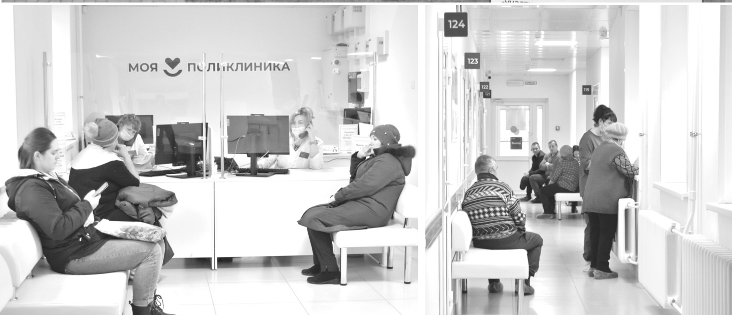
Новое здание поликлиники снаружи выглядит современно и уютно внутри. Все сделано для удобства пациентов и медицинских работников