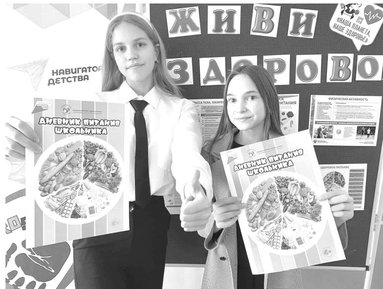
Акции по здоровому питанию стали постоянными в школе