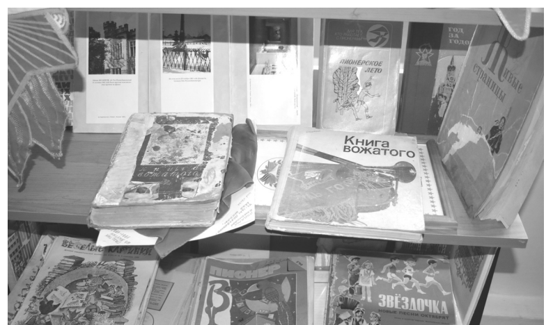
В музее на стеллажах хранятся уникальные книги и журналы