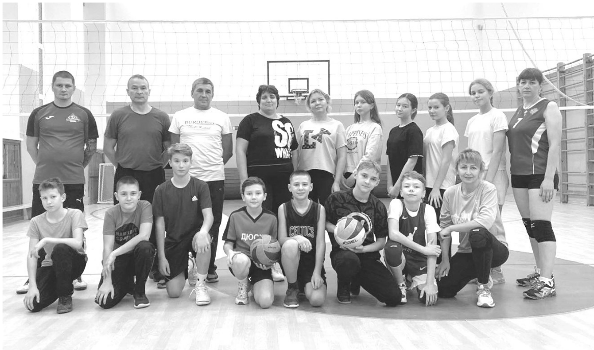
Дружная команда детей и родителей 6 «Г» класса проводит волейбольные матчи

Юлия МИХАЙЛОВА Фото из архива волонтерского отряда