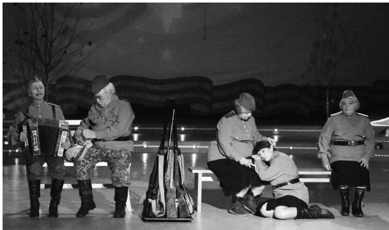
На сцене самодеятельные артисты Вагайской ветеранской первичной организации