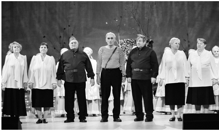
Выступает Омутинская сельская ветеранская первичная организация