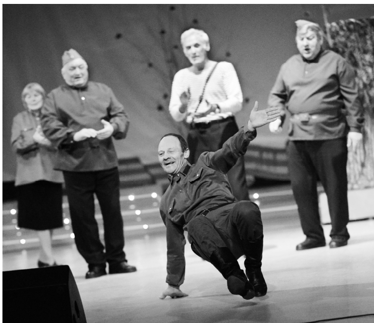
Танец на привале