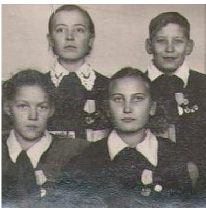
Медальисты «За освоение залежных земель»