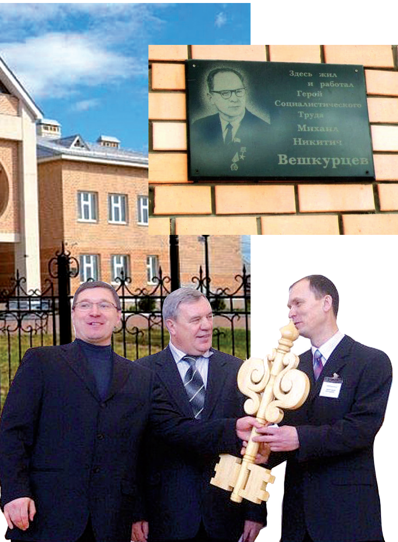
31 января 2007 года введено в эксплуатацию здание новой школы

Кроме того, учащиеся Абалакской школы вырастили для колхоза 3 500 цыплят. Школьный коллектив был отмечен многочисленными благодарностями от правления колхоза, райкома комсомола и партии. По итогам работы за 1965–1966 учебный год школа получила два переходящих Красных знамени. Одно было вручено пионерской дружке от райкома ВЛКСМ за лучшую постановку пионерской работы. Второе было присуждено педагогическому коллективу Абалакской школы решением райкома КПСС и райисполкома за лучшую успеваемость в районе и подготовку школы к новому учебному году. Список почитных наград дополнила грамота Министерства просвещения РСФСР за хорошую постановку учебно-воспитательной работы.