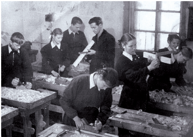
Леонид Макарович Королёв