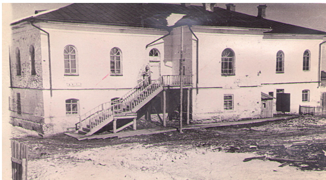
Настоятельный корпус – расположены мастерские и библиотека