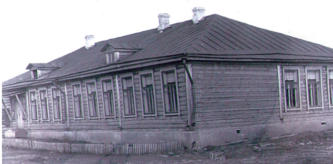
Столовая для учащихся