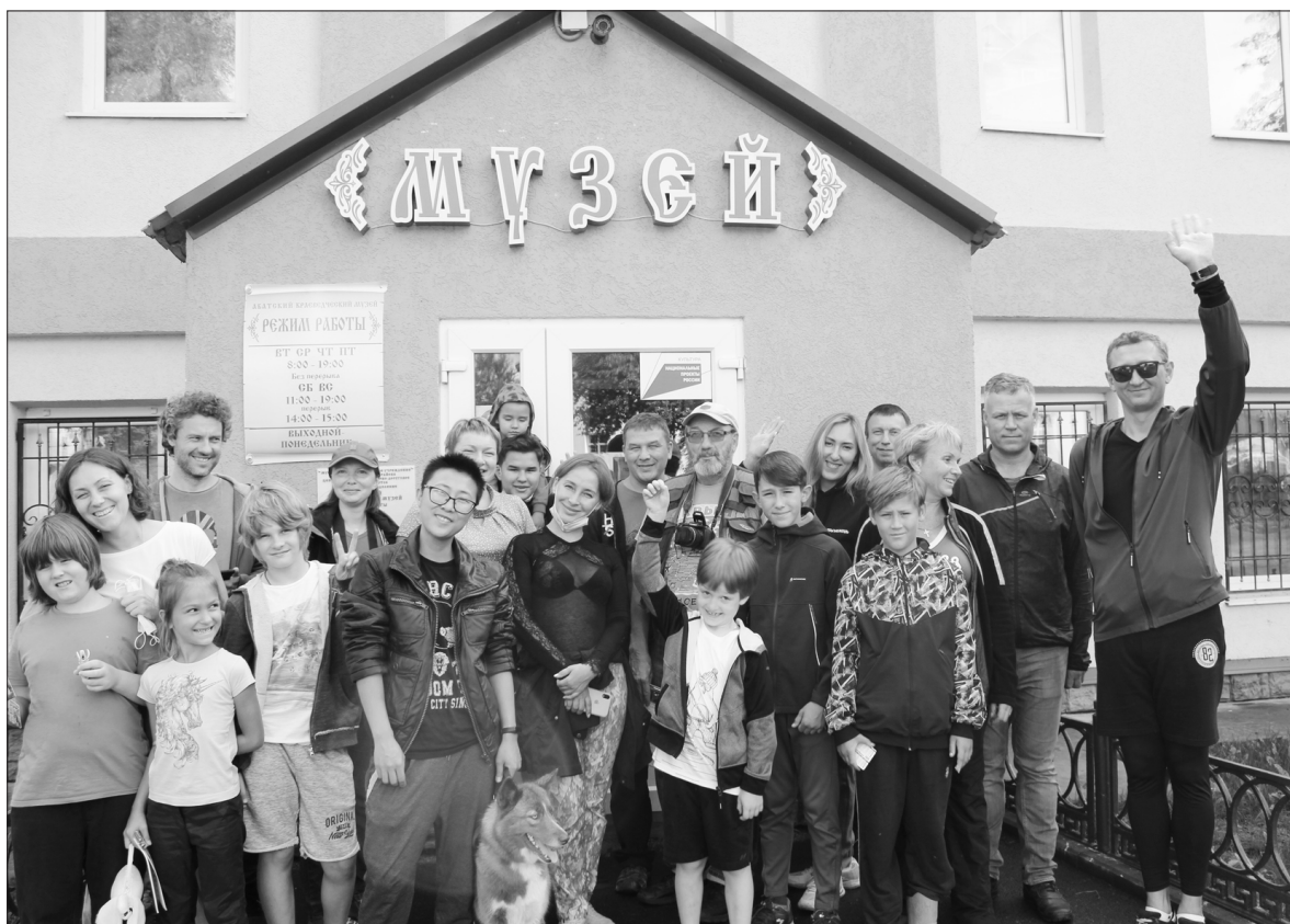
Группа палеонтологов-любителей около Абатского музея