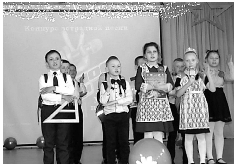
➤ с. Боково