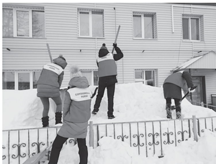
Раз, два – и горы как не бывало!

го возраста справляться с трудной для них физической работой: и воду носили, и огороды вскапывали, и снег убирали.