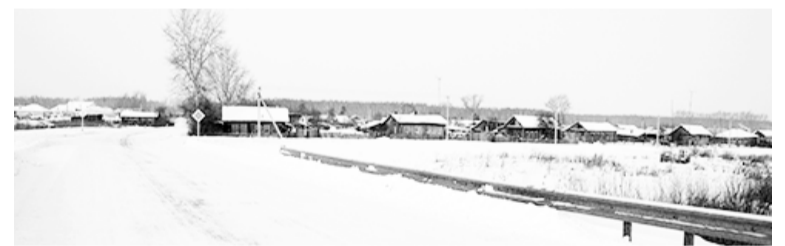
Вдали – родная Ворсиха

СПРАШИВАЛИ? ОТВЕЧАЕМ! НАШ ТЕЛЕФОН 2-12-34