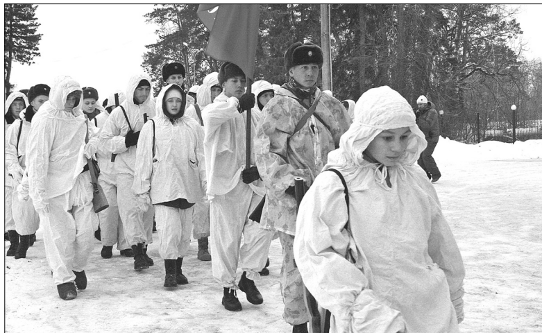
В масках, при полном вооружении «бойцы разведроты» отправились отвоювывать «подступы к Москве»

В декабре 2019-го в детском оздоровительно-образовательном центре «Алые паруса» прошёл 18-й военно-патриотический слёт «Юные ратники», где, традиционно, подвели итоги года.