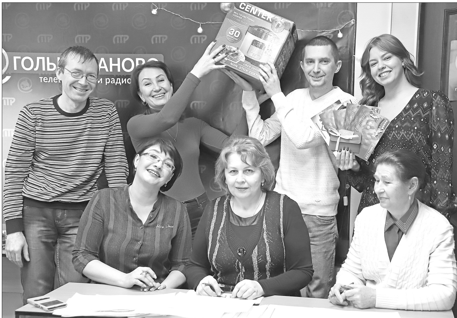
Сотрудники редакции и члены комиссии определили победителей