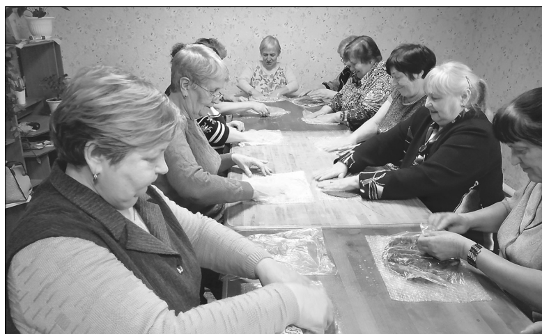
Посетительницы группы дневного пребывания старательно мастерят брошь из шерсти в технике мокрого валяния

– У нас достаточно технических средств для реабилитации взрослых и детей, – отметила Лариса Григорьевна. – Наши под-