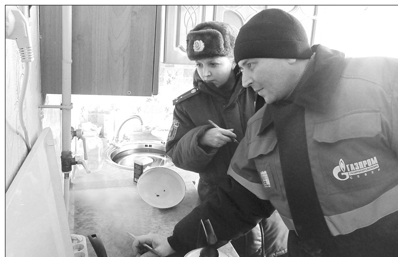
Во время рейдов специалисты обращают особое внимание на исправность газового оборудования в домах малообеспеченных многодетных семей

Оксана ТИТЕНКО