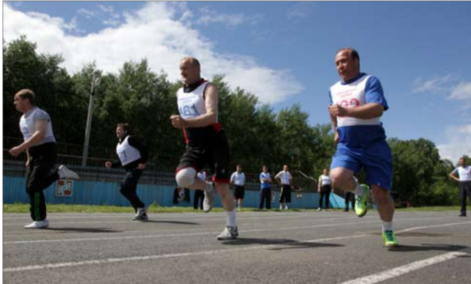
И молодость, и опыт

А первым экзаменом для работников аппарата и служащих учреждений стало выполнение комплекса ГТО. Как известно, согласно Указу президента с 2014 года сдавать эти нормативы должны и чиновники. Возраст для наших участников не стал помехой: за победу боролись и те, кто достиг 30 лет, и те, кто стар-