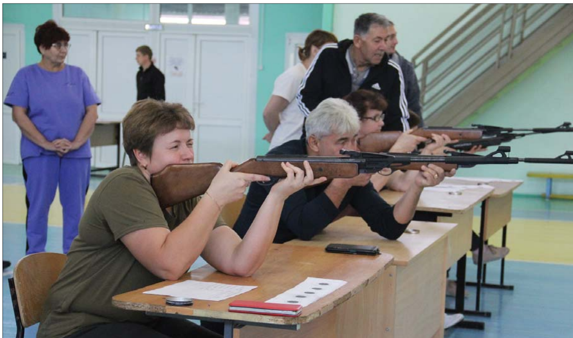
• Пробные выстрелы позади. Теперь – работа на результат.