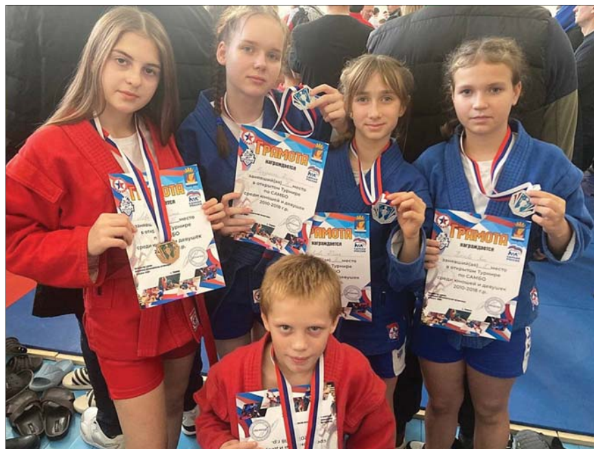
• На турнире по самбо, который недавно прошёл в Упоровском районе, наши спортсмены заняли призовые места.

Молодой рекордсмен в свои восемь лет завоевал наибольшее количество медалей среди аромашевских спортсменов по единоборству.