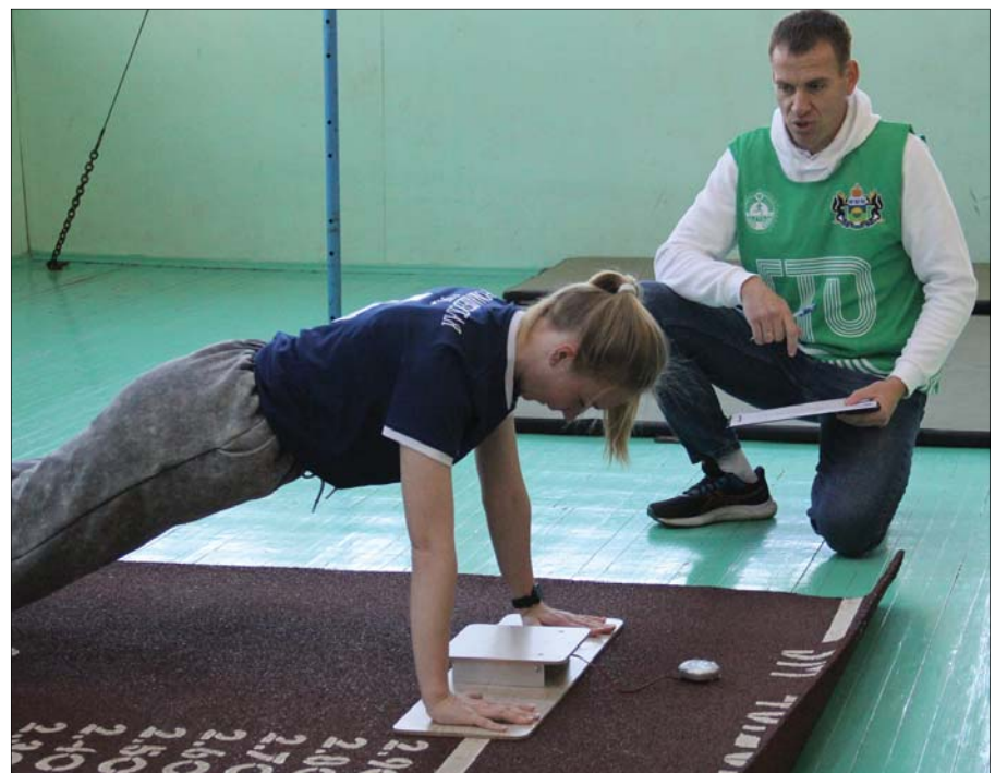
• Один из этапов спартакиады – «Эстафета ГТО».