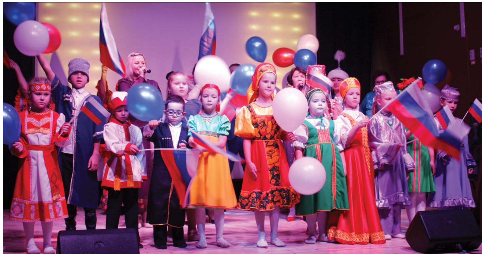
• Активное участие в праздничном концерте приняли юные артисты.

Праздничный концерт оставил у зрителей яркие впечатления, подарил хорошее настроение, а также напомнил о важности сплочённости и дружбы между людьми разной национальности, бережном отношении к национальным культурам. Словом, торжество стало поистине днём единения народов и превратилось в настоящий народный праздник.