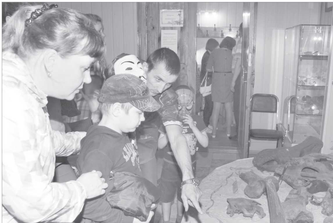
Уникальные экспонаты всегда вызывают повышенный интерес

Каждый, кто пришел в этот вечер в музей, нашел себе занятие по душе. В краеведческом интерес вызвала театрализованная экскурсия «XX век: кадр за кадром». Рассказ экскурсовода о ярких событиях прошлого столетия сопровождался сценками, представленными студентами и учащимися. В рамках экскурсии органично вписался рассказ о редкой иконе Николае Чудотворца с избранными святыми, только что вернувшейся в музей после реставрации. С удовольствием и взрослые, и молодежь угадывали персонажей в киновикторине «Внимание, мотор!». А кто-то, не успев в свое время познакомиться с живописными работами московской художни-