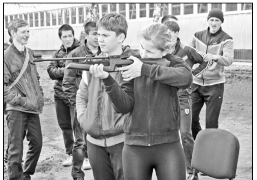
Девушки выполняли задания наравне с юношами

Участвовало в соревнованиях шесть ребячьих команд из Ильинки, Грачей, Челюскинцев, Новоси-