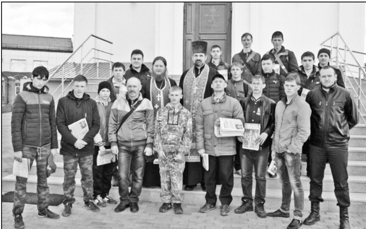
Участники соревнований после молебна в Казанском храме