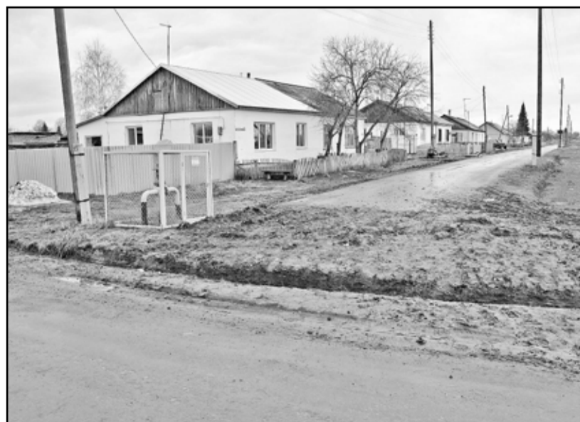
Эти несколько метров печали