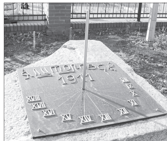
Часы на перроне показывают текущее время и дату постройки вокзала