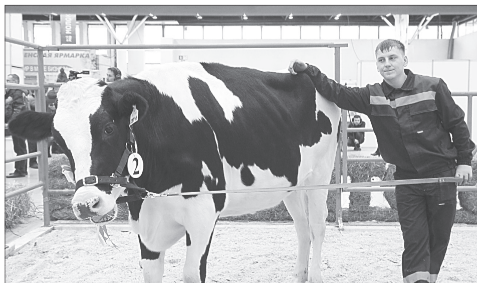
Голштинки с удовольствием позировали гостям выставки, которые были не прочь сделать селфи с бурёнками