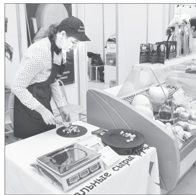
Сыры от тюменских производителей можно было продегустировать даже в жареном виде