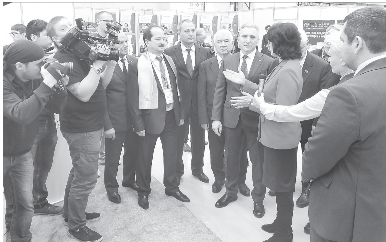
Делегация правительства области надолго задержалась в научном секторе, где демонстрировались передовые технологии сельского хозяйства и образования

трактор на автопилоте и более ста видов сыров