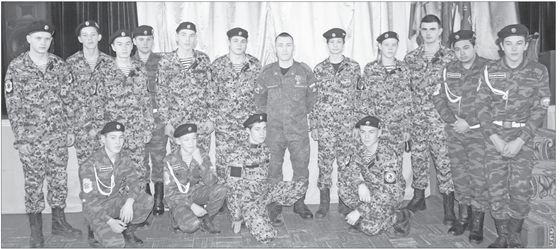
Будущие призывники Нижнетавдинского района с героем-земляком.