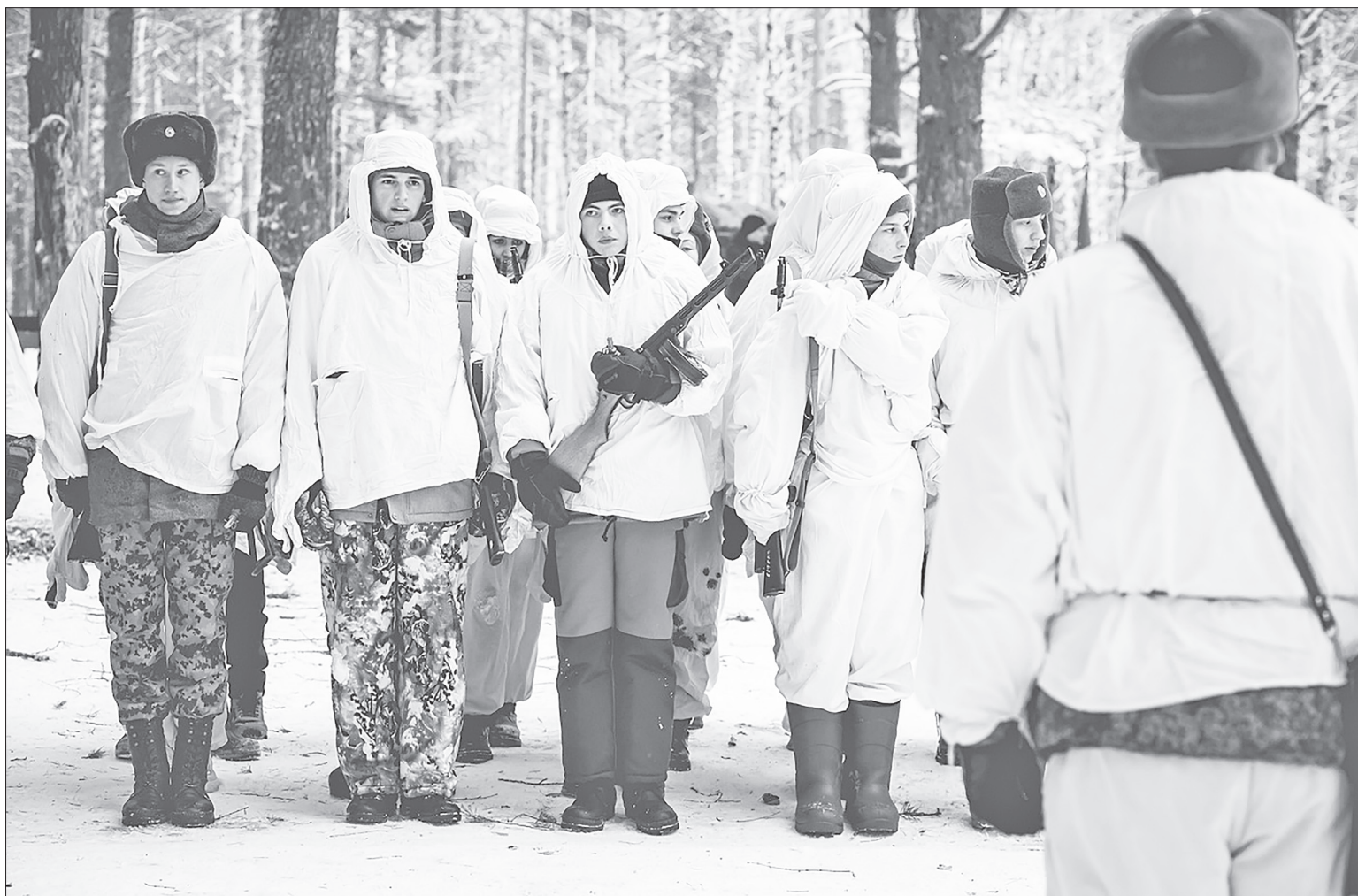
Воспитанники специализированной группы «Русские витязи» перед началом реконструкции.

Исторический экскурс. Битва за Москву является одним из величайших и переломных событий Великой Отечественной войны. Она началась 30 сентября 1941 года и завершилась 20 апреля 1942 года. Красная армия находилась в сложном положении: немецкие войска захватили Прибалтику, Белоруссию, Молдавию, значительную часть Украины, блокировали Ленинград. Следующей целью стала Москва