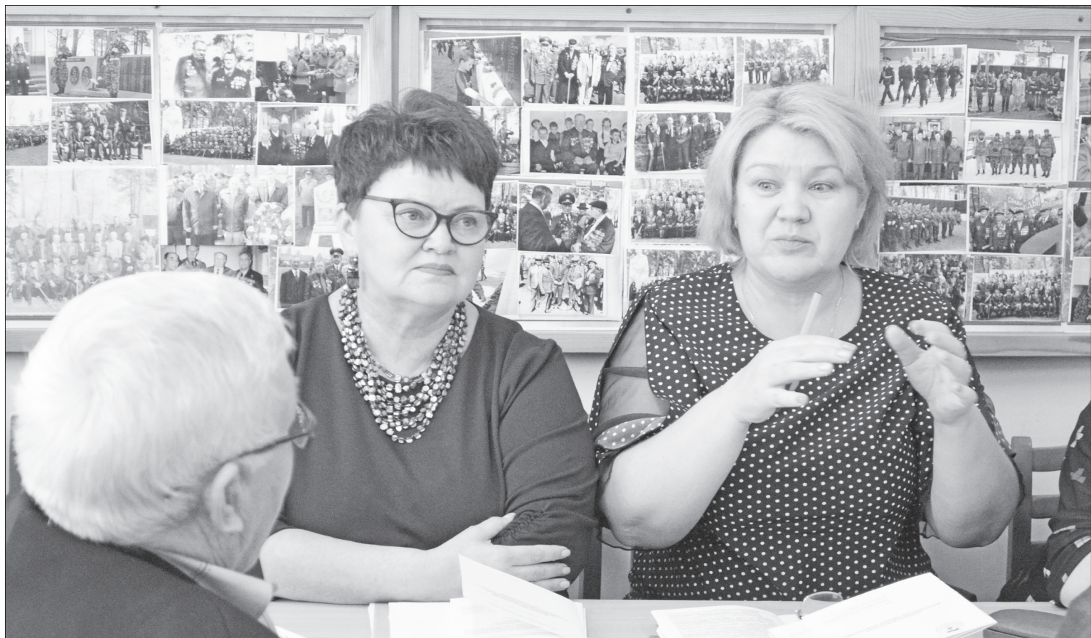
На семинаре Совета ветеранов Нижнетавдинского района идёт бурное обсуждение проблем добровольчества среди представителей старшего поколения.