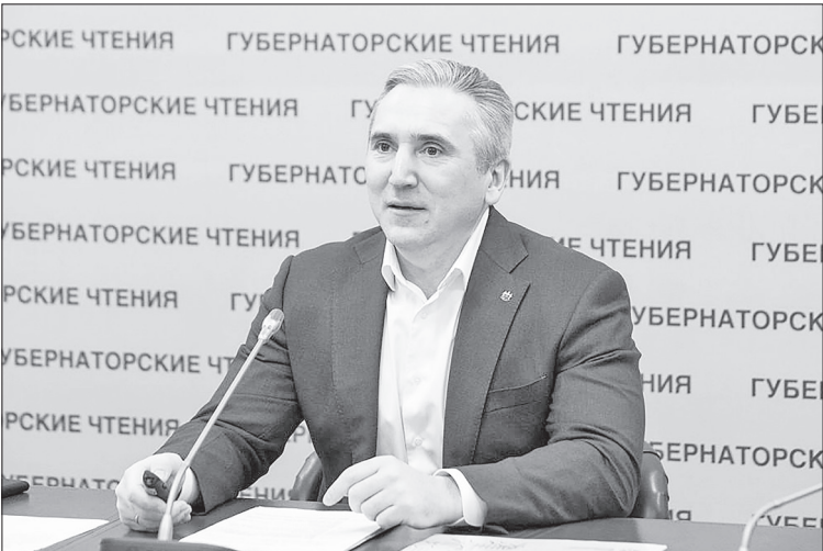
Александр Моор.

О доходах, трудовых ресурсах и перспективах. Обычных читателей, которые не являются большими экономистами, в первую очередь интересуют доходы. Анализ показывает, что в России есть определённый парадокс, если сравнивать с экономически развитыми странами. Несмотря на то, что доходы у нас выросли, более 50 процентов рас