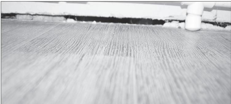
Такие щели по всему периметру ванной комнаты. Из них дует ледяной сквозняк.

что она занималась, сгорбившись. То ли поэтому, то ли из-за других причин у неё развился сколиоз. Девочке сделали операцию в Кургане, поставили металлические элементы по всей спине, и теперь у неё подтверждённая бессрочная инвалидность третьей группы, а раньше она была ребёнком-инвалидом. У редакции есть фотографии справки, подтверждающей её состояние здоровья.