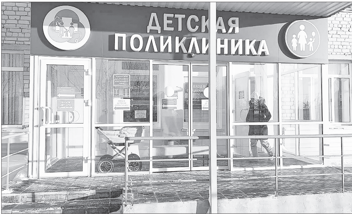
■ Та самая зона ожидания для маленьких пациентов фильтр-бокса в Областной больнице № 15. В настоящее время очередей не наблюдается.