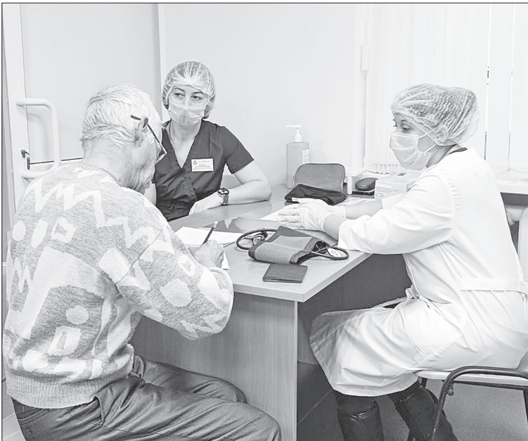
■ Перед сдачей крови доноры проходят обязательную проверку.

Так что если есть желание стать донором и помочь кому-то в сложной ситуации, и если вы здоровы – сдавайте кровь.