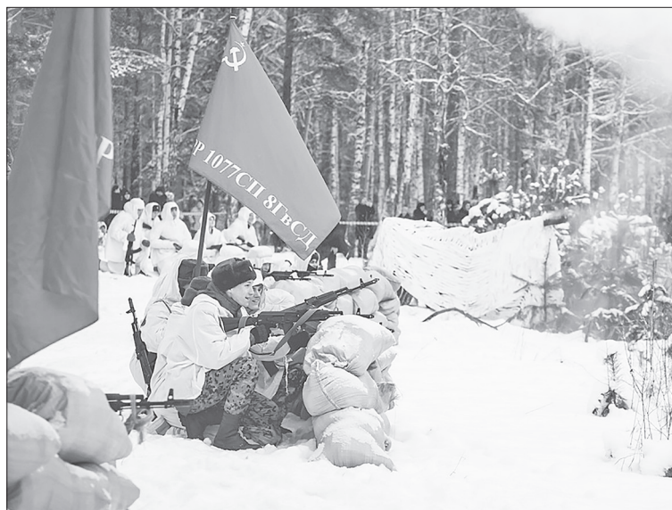
Знамёна, дым и взрывы – реконструкция получилась красочной и эффектной.

– политический и стратегический центр Советского Союза. Фашистские войска планировали с трёх направлений окружить в районе Брянска и Вязьмы основные силы Советов, обойти Москву с севера и юга и захватить её в клешни. Но, как мы знаем, ничего у гитлеровцев не вышло. 5 декабря 1941 года наши войска перешли в контрнаступление, полностью ликвидировав прямую угрозу столице.