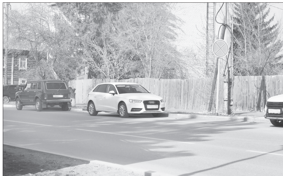
Улицы города и так неширокие, а водители ставят авто не только впритык к пешеходным переходам, ограничивая обзор, но и прямо под запрещающими знаками

Обсудили необходимость камер видеонаблюдения на ул. Комсомольской, так как есть сообщения о нарушениях там скоростного режима. Рабочей группе необходимо проанализировать частоту ДТП и определить первоочередные точки установки камер.