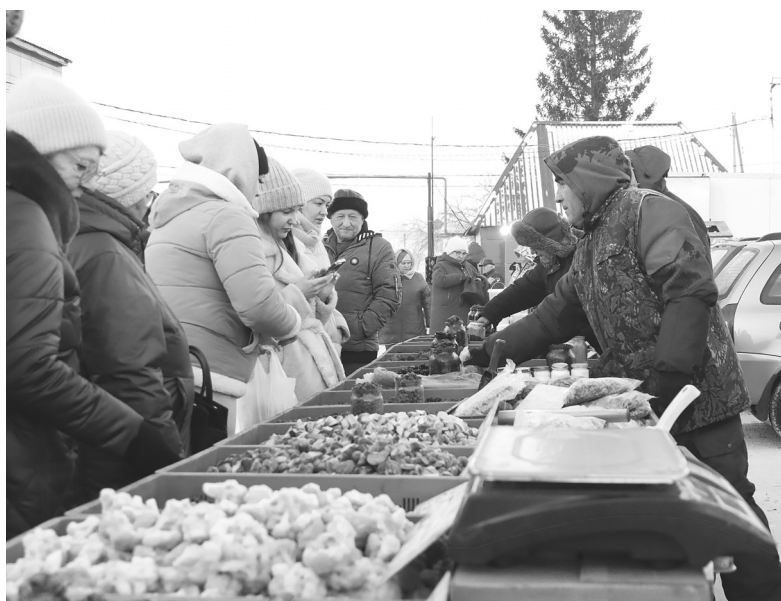
Ягоды и замороженные овощи, привезённые торговцами из Ишима, пользовались большим спросом у голышмановцев

Более 30 предпринимателей, владельцев личных подсобных хозяйств и обычных граждан представили свой товар на сельскохозяйственной ярмарке в посёлке Голышманово.