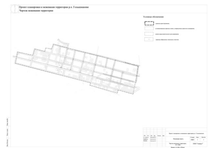
Раздел 3 Материалы по обоснованию проекта межевания территории. Графическая часть