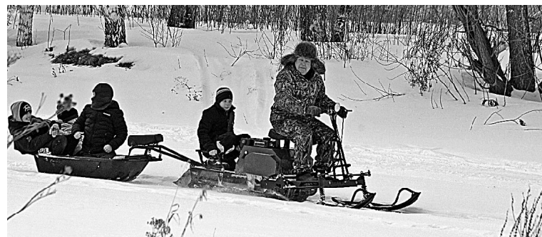
➤ Проводы зимы в Балаганах