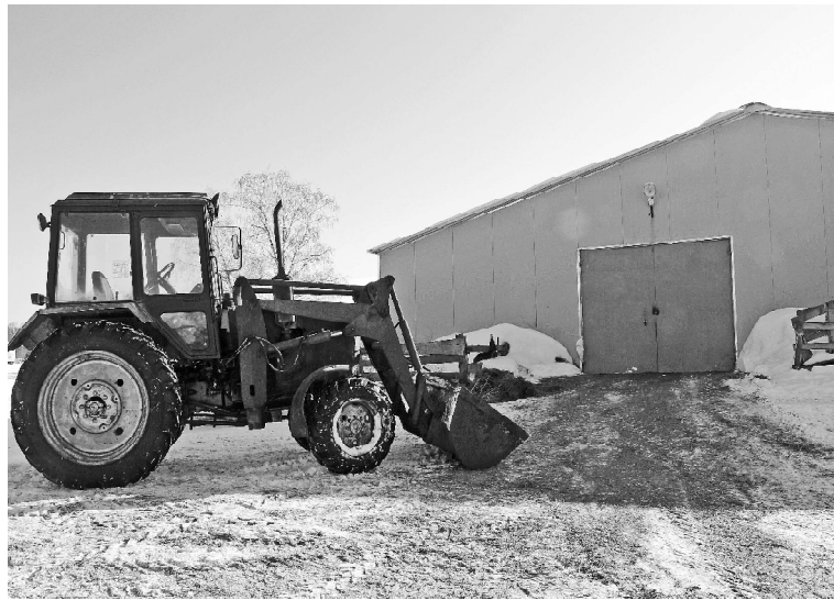
➤ На мини-ферме, д. Петрова