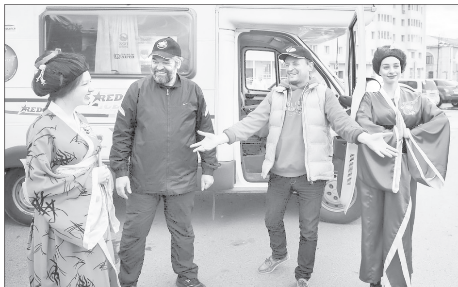
Автопутешественникам пришлось по нраву тюменское гостеприимство

В эту субботу участники автопробега, посвященного перекрестному году Японии в России, побывали в Тюмени.