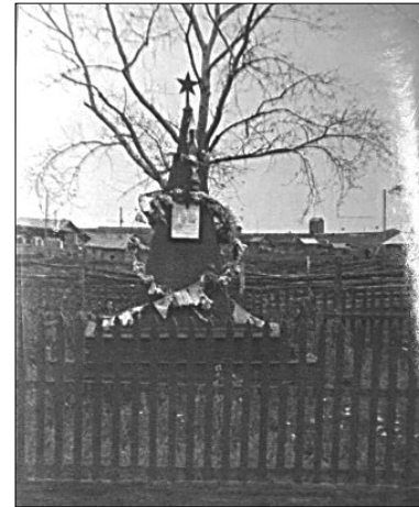
С. Евсино. Братская могила погибших в 1921 году