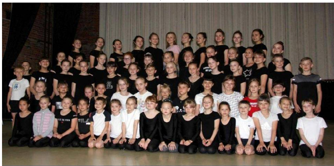
» Образцовый любительский коллектив — ансамбль танца «Фиеста»

С юбилеем, «Фиеста»! Новых ярких побед и таких же ярких будней! Олеся СУББОТИНА