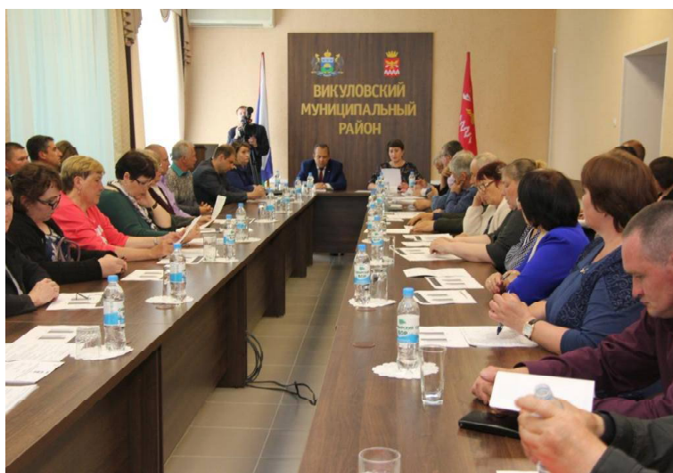
➤ На заседании районной Думы