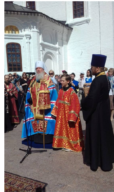
» Митрополит Димитрий общается с журналистами.