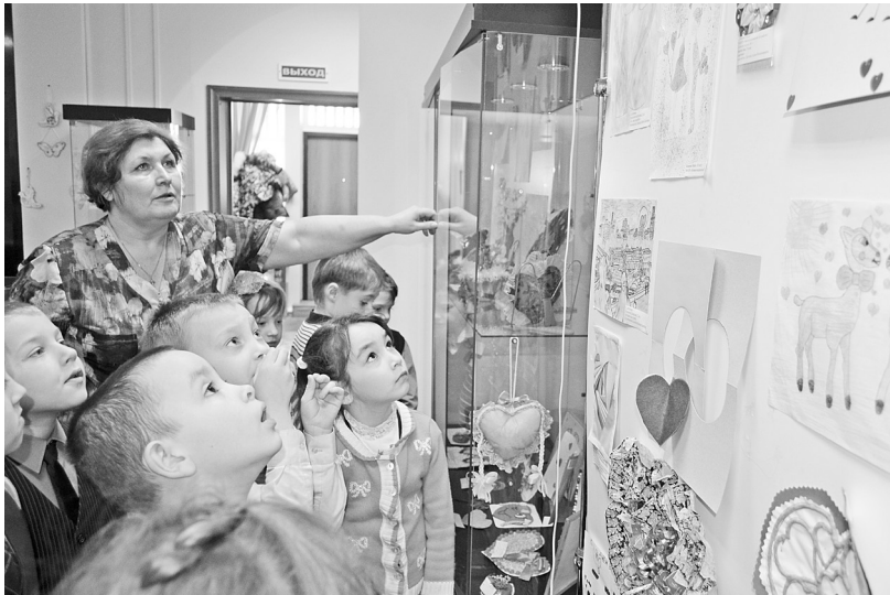
«Сколько красивых рисунков! А мой тоже здесь?» – такие мысли у посетителей выставки.