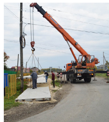
Вдоль улицы Российской укладка шестиметровых дорожных плит для тротуара производится автокраном