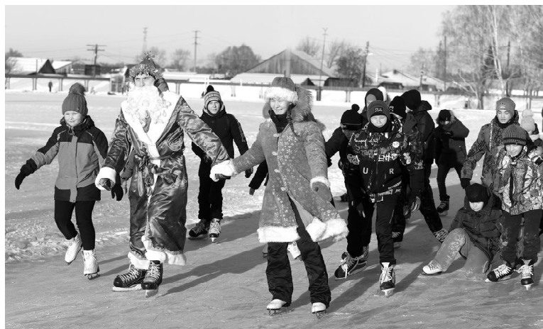
Омутинская ребятня поучаствовала в массовом заезде с Дедом Морозом и Снегурочкой

В середине декабря спортсмены и любители активного образа жизни смогли принять участие в нескольких мероприятиях, приуроченных к открытию в Омутинском районе зимнего спортивного сезона.