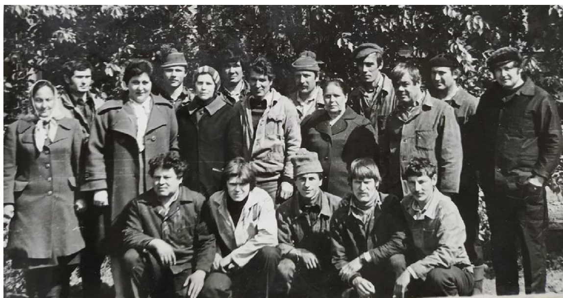
Рабочие литейного цеха, 1983 год

В авторемонтном цехе ремонтировали автомшины ЗИС-355 и ГАЗ-69 в гораздо большем объеме, чем в первые годы образования завода. В 1966 году к старому корпусу мастерской пристроили помещение с южной стороны, площадью