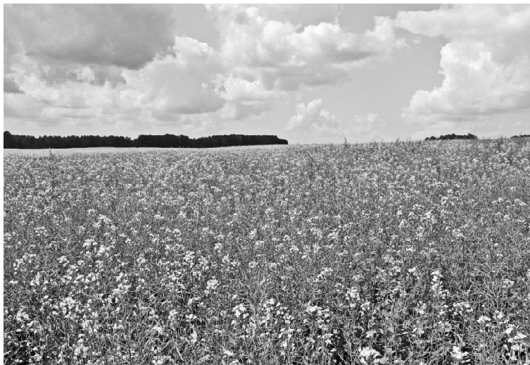
› Рапсовое поле

Глазами обывателя видно, что поле отличается от тех, что мы видели ранее. Эта культура имеет многоусость, что делает её устойчивой. Побеги усов дают прочность растению, и нет полегания. Период созревания — 64-95 дней, кроме всего, растение устойчиво к растрескиванию бобов. Это высокопродуктивный технологичный сорт посевного гороха зернового и зерноукосного направления использования. Высокая стабильность и качество зерна дают высокие ку-