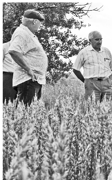
› Делегация аграриев в ЗАО «Экос»