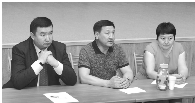
Представители «Национально-культурной автономии казахов Тюменской области»