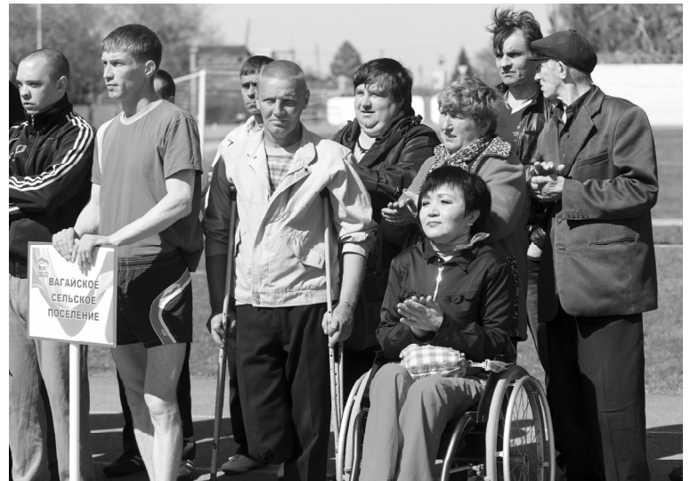
Участники соревнований настроены на победу