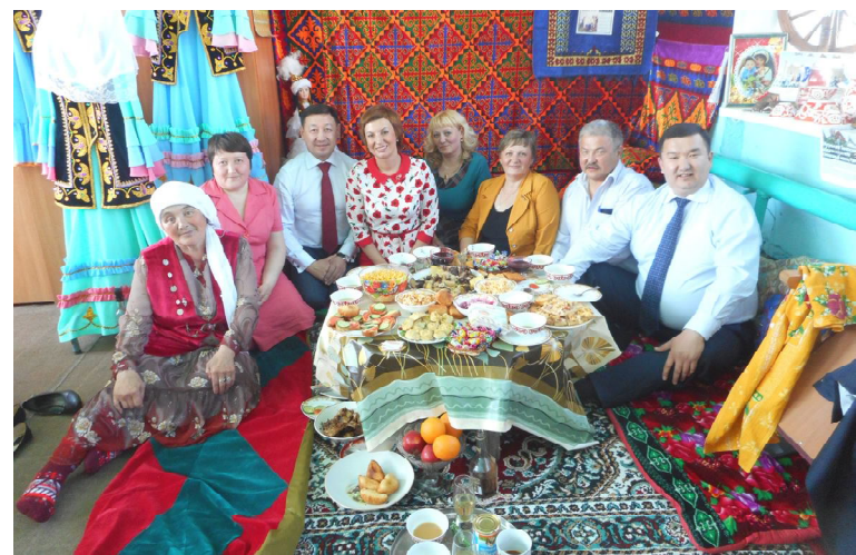
Участники встречи