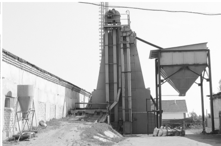
* Сушильная установка на заводе позволяет довести зерно до нужных кондиций.