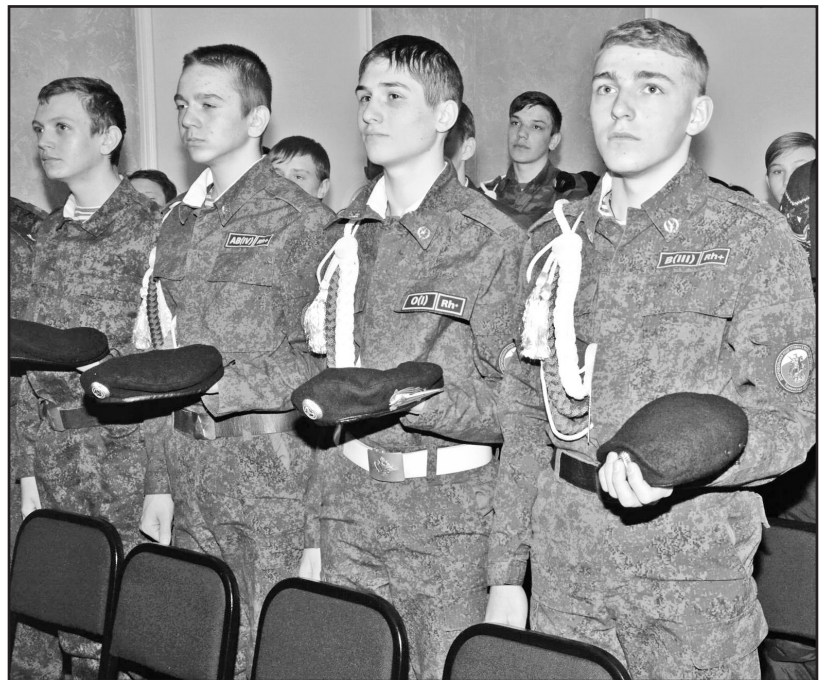
Кадеты чтят память о погибших