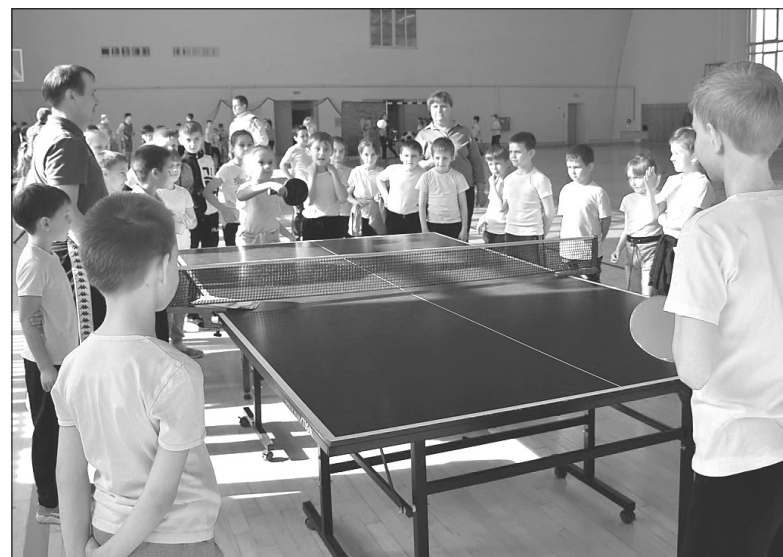
Теннисисты показывают хорошие результаты на соревнованиях

Оксана ТИТЕНКО