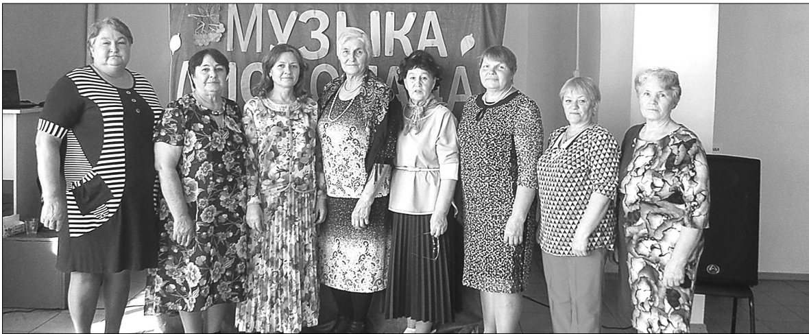
Черемшанские пенсионеры на мероприятии в доме культуры получили заряд хорошего настроения