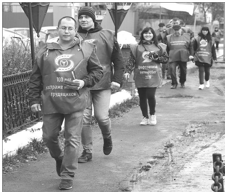
Участники автопробега приехали вручить награды лучшим работникам Голышмановского участка ДРСУ-4