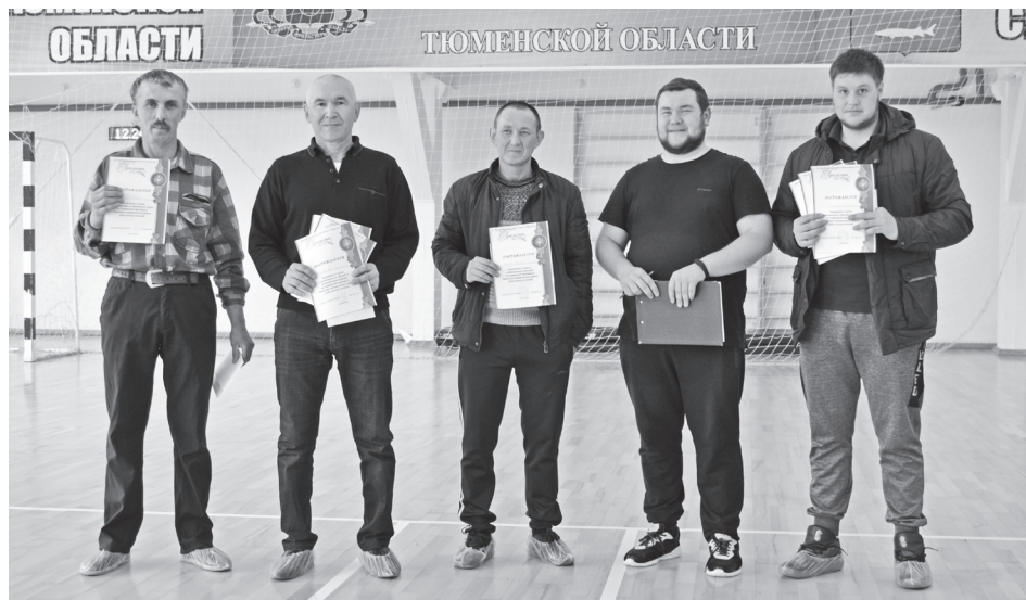
На снимках: победители и призеры спартакиады