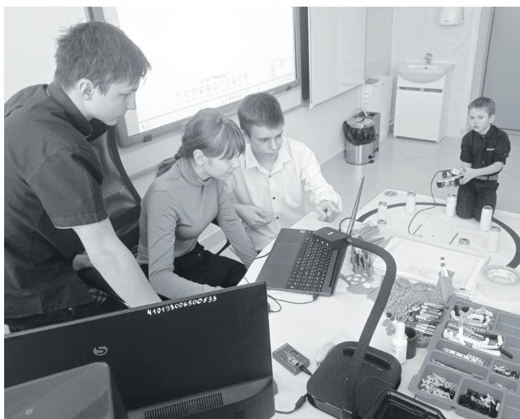
Ребята увлечённо осваивают современные технологии.

Лидия СОСНИНА.