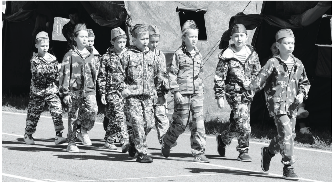
Упоровские «Витязи» чётким шагом промаршировали под песню «Шли солдаты на войну».

– С пятого класса я состояла в юнгарии, сейчас вхожу в состав СГ ДПВС «Витязь». На «Зарницу» мы приезжаем не в первый раз. Считаю, что для сплочённости команды эта игра отлично подходит. Сегодня очень волновалась, хотелось обойти всех соперников и стать первыми. Самым ярким и запоминающимся для меня было испытание на знание отечественной истории, –