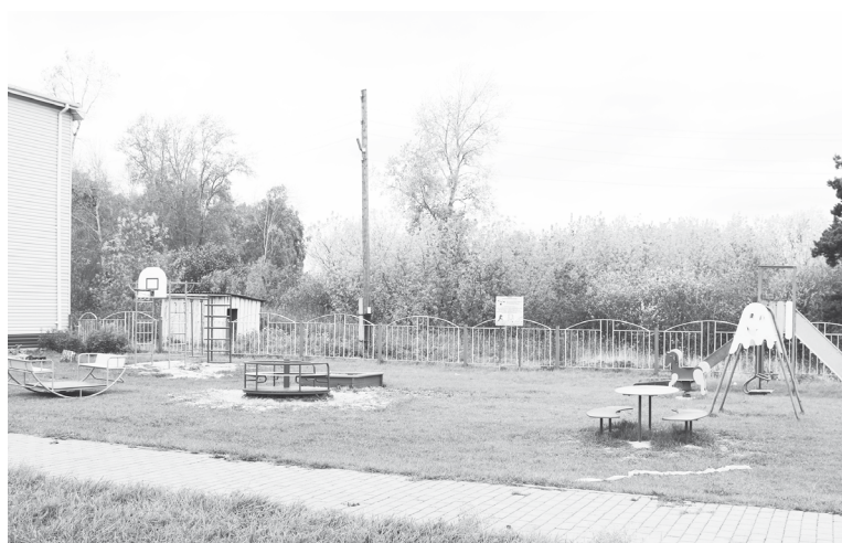
На территории Дома культуры установлена новая детская площадка

Перечисленное – самое масштабное в жизни села. Кроме этого, решали повседневные вопросы благоустройства – приводили в порядок места общего пользования, выполнили наружный ремонт трёх колодцев. Скашивали траву, в том числе на территории кладбища, привлекая рабочих от Центра занятости и несовершеннолетних. Ведут работу по обустройству