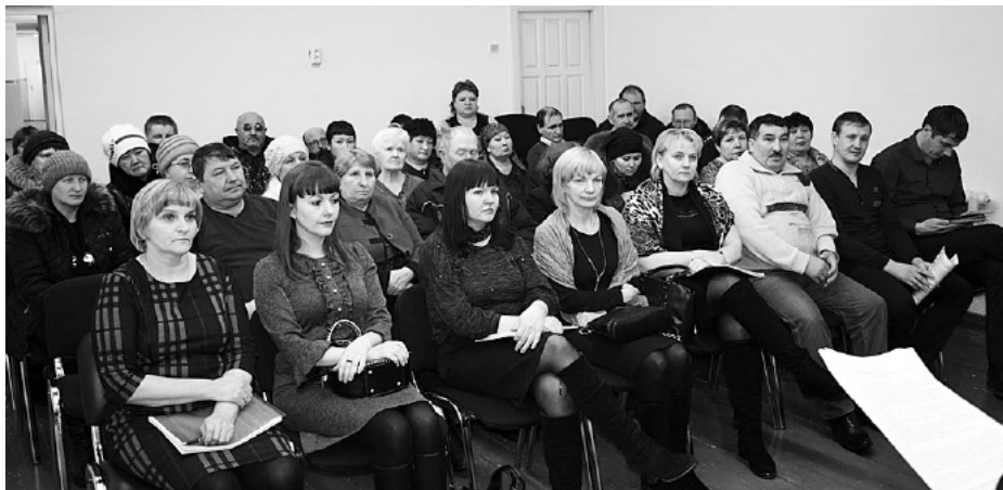
Участники схода граждан в селе Мелехино.