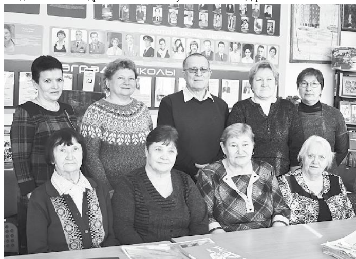
Члены литературного объединения.

представлял себя, свое творчество, ощущая в эти минуты заинтересованность и поддержку. Мне очень понравилось наше совместное мероприятие, полагаю, что и другим участникам тоже. А свои ощущения по данному поводу я неожиданно вложила в