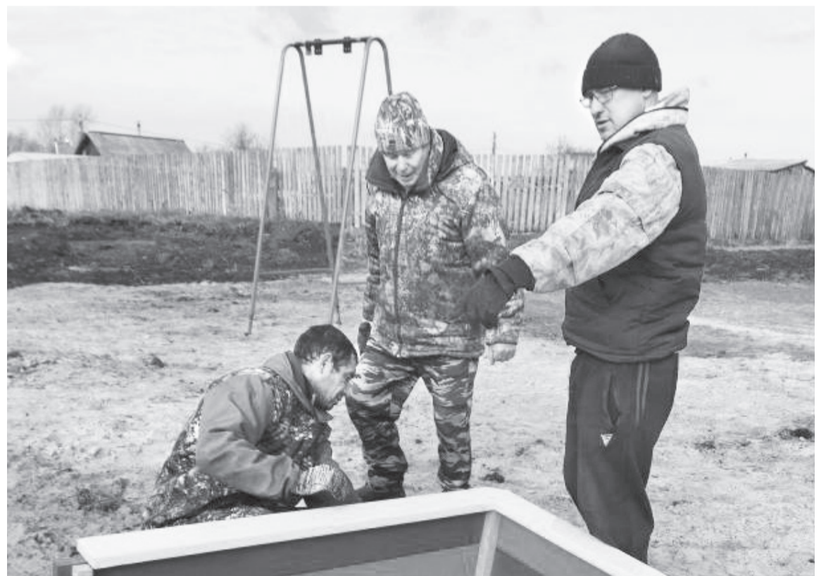
Осеевцы с энтузиазмом взялись за строительство детской площадки.

По заказу администрации Буньковского с/п подготовила Светлана АЛЕКСАНДРОВА.