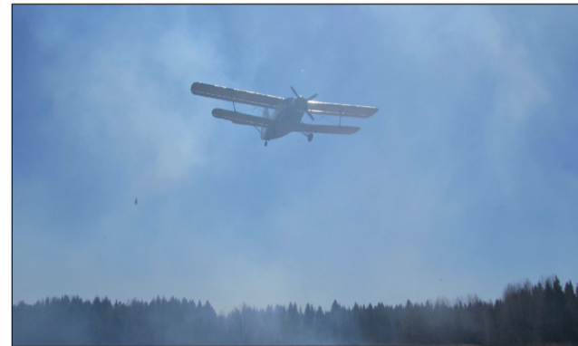
В связи с повышением класса пожарной опасности в трёх районах Тюменской области ведётся ежедневное авиатрулирование лесов.

С воздуха за лесопожарной обстановкой следят в Тюменском, Ишимском и Тобольском районах. Здесь для работы привлекается воздушное судно Орион СК-12. Напомним, конструкторские особенности Ориона позволяют длительно эксплуатировать его в отрыве от основной базы. Таким образом, летчики-наблюдатели находятся в небе до 4 часов. Это позволяет повысить оперативность обнаружения пожаров. Так, с помощью авиатрулирования было обнаружено 10 лесных пожаров. В небо воздушные суда поднимаются в зависимости от погодных условий. С начала пожароопасного сезона в Тюмени авиация привлекалась 15 раз, в Ишиме - 11, в Увате - 4 и в Тобольске - 2 раза. Общий налет при этом составил более 120 часов.