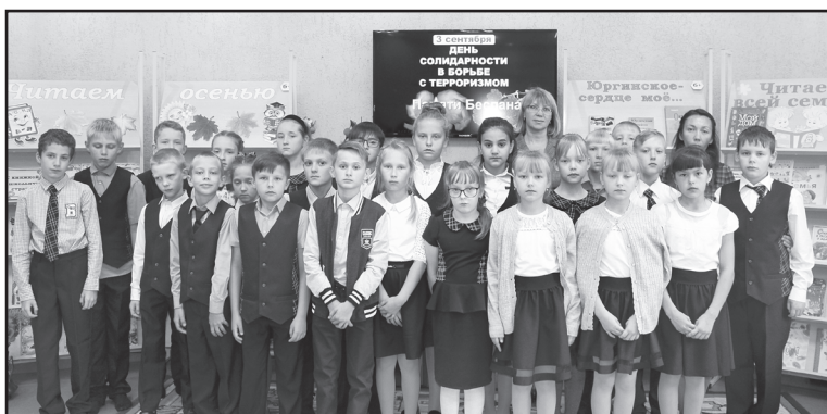
На час памяти в Детскую библиотеку пришли учащиеся Юргинской школы

Этот День солидарности был установлен в 2005 году в соответствии с Федеральным законом Российской Федерации «О днях воинской славы (победных днях) России». День знаний стал днём траура и скорби не только для жителей Беслана, Северной Осетии, но и для всей России. Тот террористический акт, когда во время праздничной линейки, посвящённой 1 сентября, в школу № 1 города Беслана проникли боевики и захватили в заложники учителей, детей и их родственников, стал последней каплей, переполнившей чашу людского терпения. Сегодня в День солидарности борьбы с терроризмом россия-