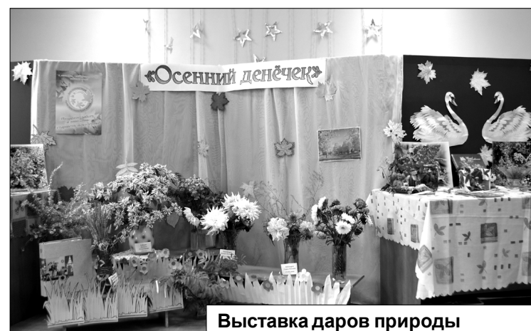
Выставка даров природы