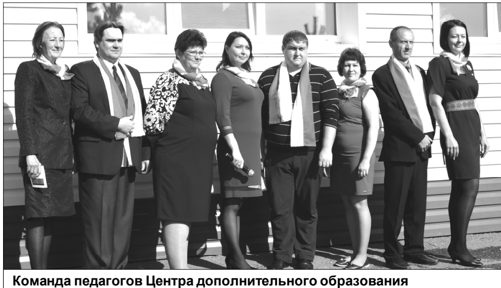
Команда педагогов Центра дополнительного образования