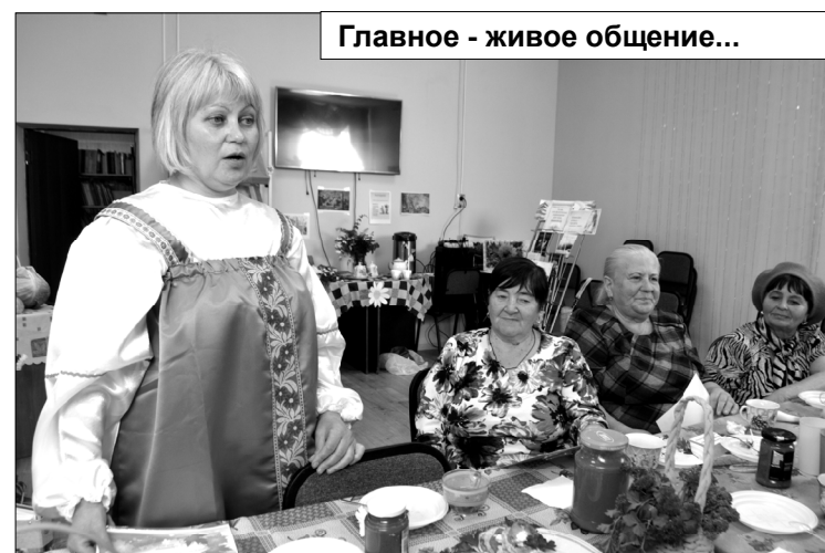
Главное - живое общение...

В рамках национального проекта «Демография» сотрудники районной библиотеки провели мероприятие «Осенний денечек», участниками которого стали пенсионеры.