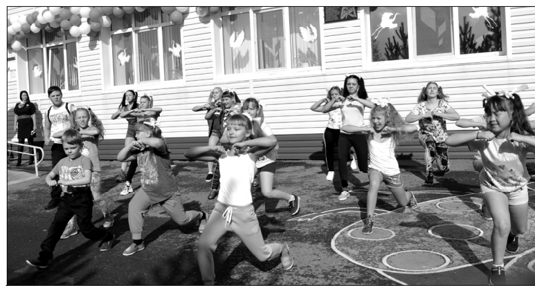
Танцевальный номер настроил на позитив