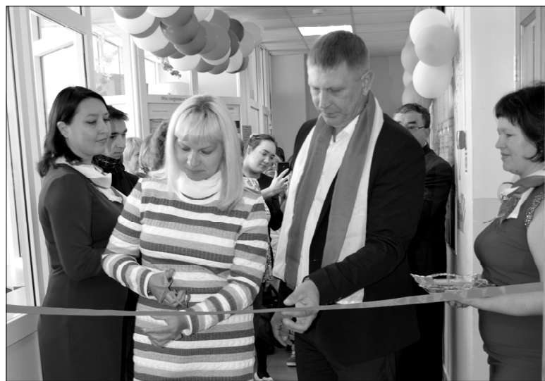
Красная лента перерезана: «Точка роста» начинает свою работу

В кабинете технического творчества, программа которого очень обширна и включает в себя различные блоки и модули, девочки и мальчики 3Д-ручками реализовывали дизайнерский проект. Они создавали логотип Центра «Точка роста»