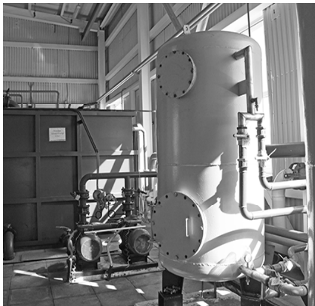
* Очистные работают без сбоев