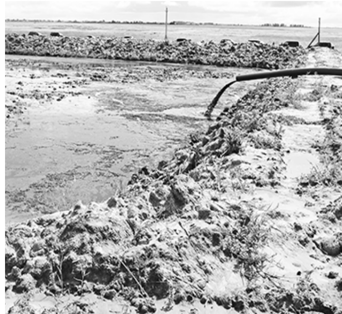
* Очистка оз.Дедюхино