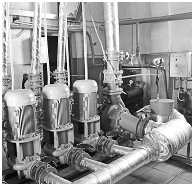
* Оборудование котельных в порядке

Беседу вела Елена ДАНИЛЬЧЕНКО