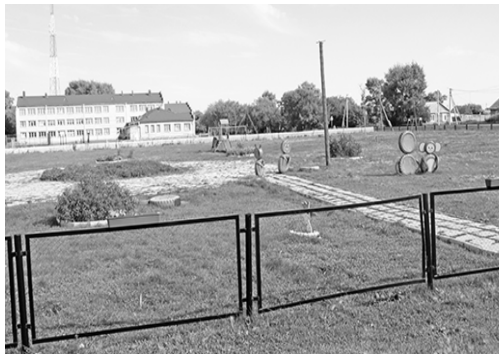
* Центральная площадь Усова

отличается тем, что её изгородь украшают вазоны с цветами. Что-то новое и необычное не придумали в этом году, не привнесли в общую картину села?