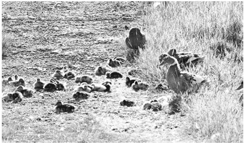
* Утиное семейство