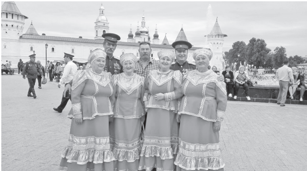
Ансамбль казачьей песни «Черевички»

Ансамбль казачьей песни «Черевички» (руководитель Н.И. Клиноква) участвовал в двух конкурсах: «Хуторское казачье общество Уватское» и