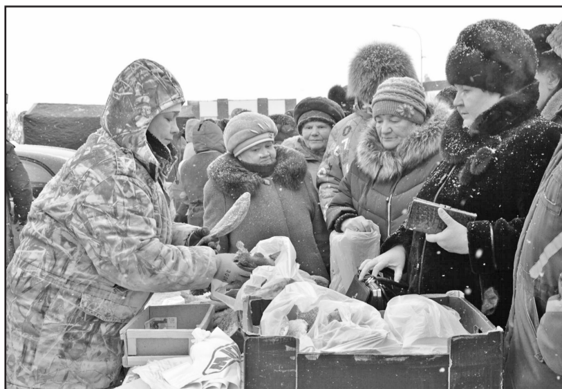
Любят казанцы рыбку