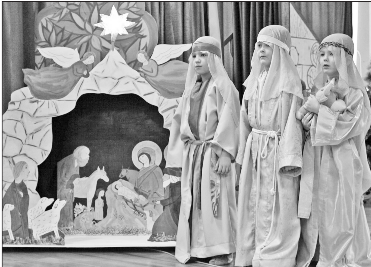
Сценка из рождественского спектакля, который подготовили учащиеся воскресной школы

Все мы, взрослые, иногда (а, может быть, всегда) хотим вернуться в детство. В нём нам было уютно, светло и тепло. Хотелось бы не только вернуться в детство, но сделаться снова детьми. И вот у нас есть такая возможность вернуться в детство, стать детьми – через праздник Рождества Христова, когда Бог стал ребёнком, вручил Себя нам.