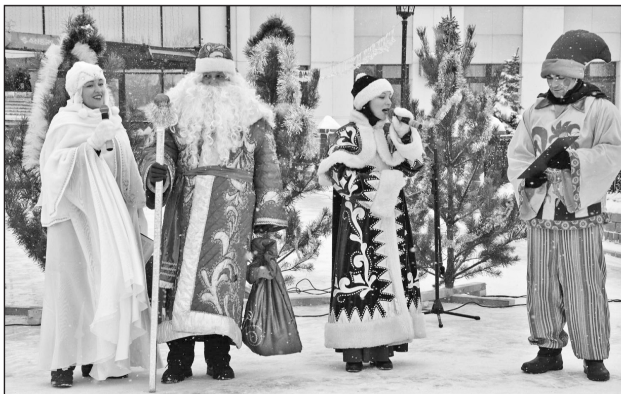
Ну какое же предновогоднее ярмарочное представление без Деда Мороза, Снегурочки, Зимушки-Зимы и Скоморохов?!