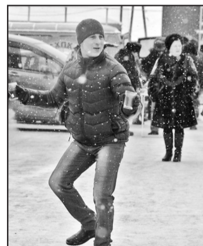
Главное – веселиться самому

воселёвского и Ильинского домов культуры. Привлекали внимание зрителей и конкурсы, один из которых назывался «Знай наших». Тот, кто правильно отвечал на заданные вопросы о том или ином предприятии, функционирующем в районе, получал подарок – продукцию этого предприятия.