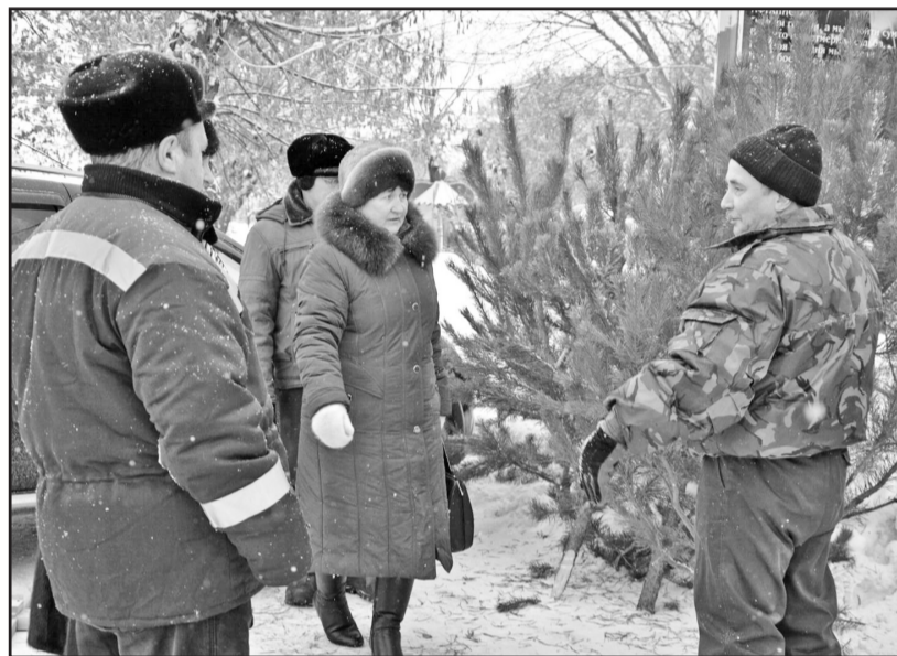
Сосёнки на ярмарке пользовались особым спросом

Также поднимали предпраздничное настроение ярмарочному люду работники районного ДК. Предпраздничная новогодняя программа с Дедом Морозом, Снегурочкой и Скоморохами порадовала присутствующих. Песни исполняли участники художественной самодеятельности из Казанского, Но-