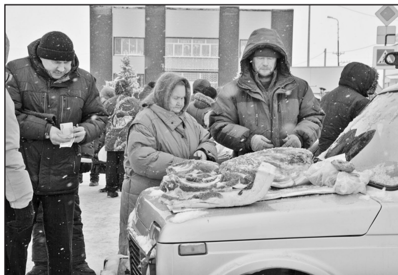
Мясо, как всегда, шло нарасхват