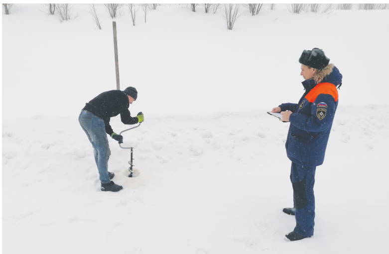
Болото – не асфальт

Но через неделю у школьников наступят каникулы, а значит, необходимо продумать отправку домой детей, проживающих в интернате. Есть вероятность, что обычным путём не получится, так как подрядчик, обслуживавший зимники, намерен распилить ледовые переправы.