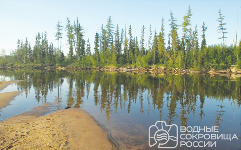
Одна из фотографий-победителей