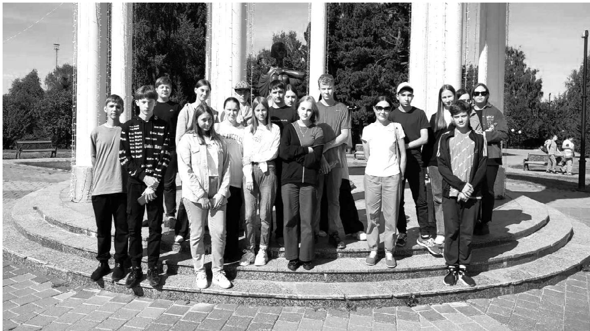
» Экскурсия в Тобольск

Вот и наступило ранее утро 12-ого дня в лагере «Авангард». На часах показывает 5:45, и наш отряд отправляется в увлекательное путешествие в город Тобольск. В Сорочкино встретились с отцом Владимиром и экскурсоводом и продолжили наш путь. До города ехать долго, поэтому кто-то играл в мобильные игры, а кто-то читал книги или просто беседовал с друзьями.