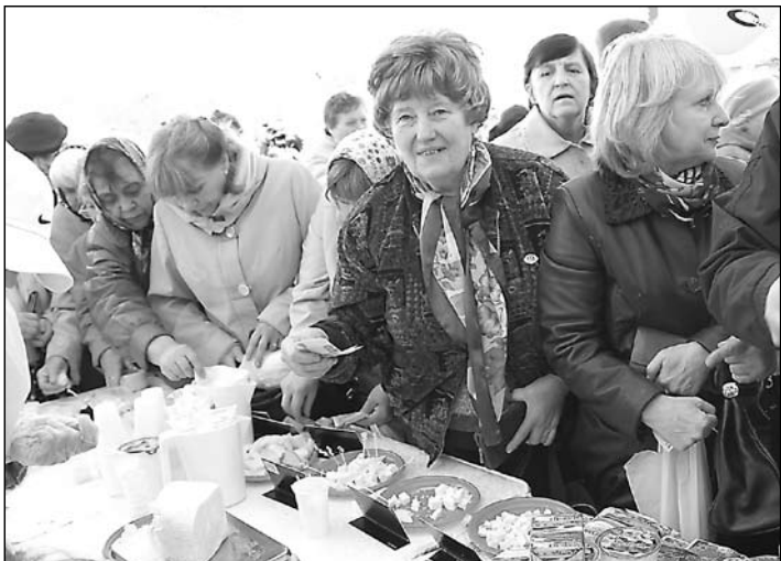
– Мы выбираем местные продукты!