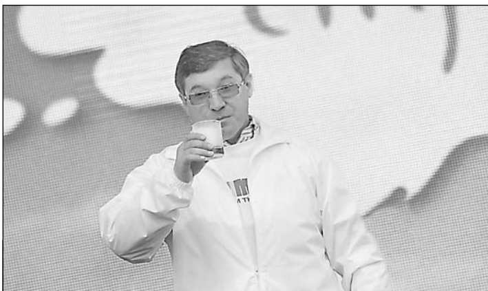
Губернатор В. Якушев: «Наше молоко – самое вкусное и полезное»